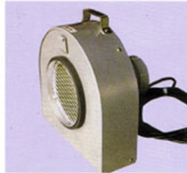
排風機(意匠登録済)