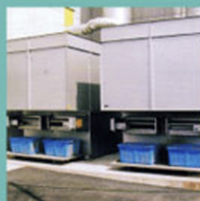
大豆施設、 貯留びん用 機械各部用 SCR-400